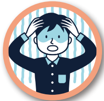
相手にうまく伝わらない!