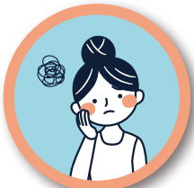
怒りたいのを我慢してイライラ