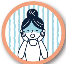
叱られるのが怖い!