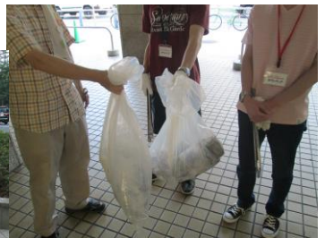
たくさん拾えました!